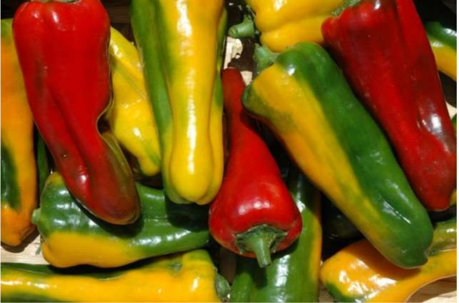
Peperone - dall'America all'Europa