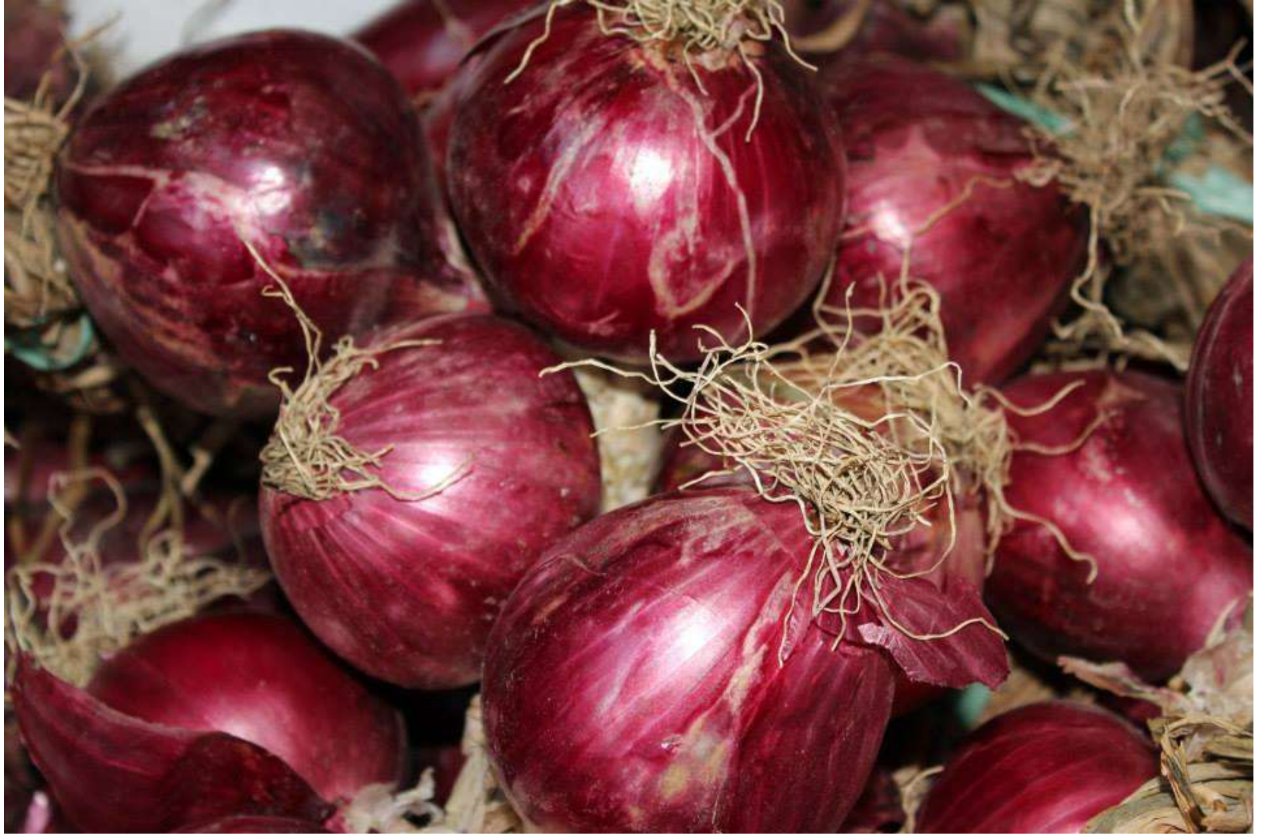
Cipolla - dall'Europa all'America