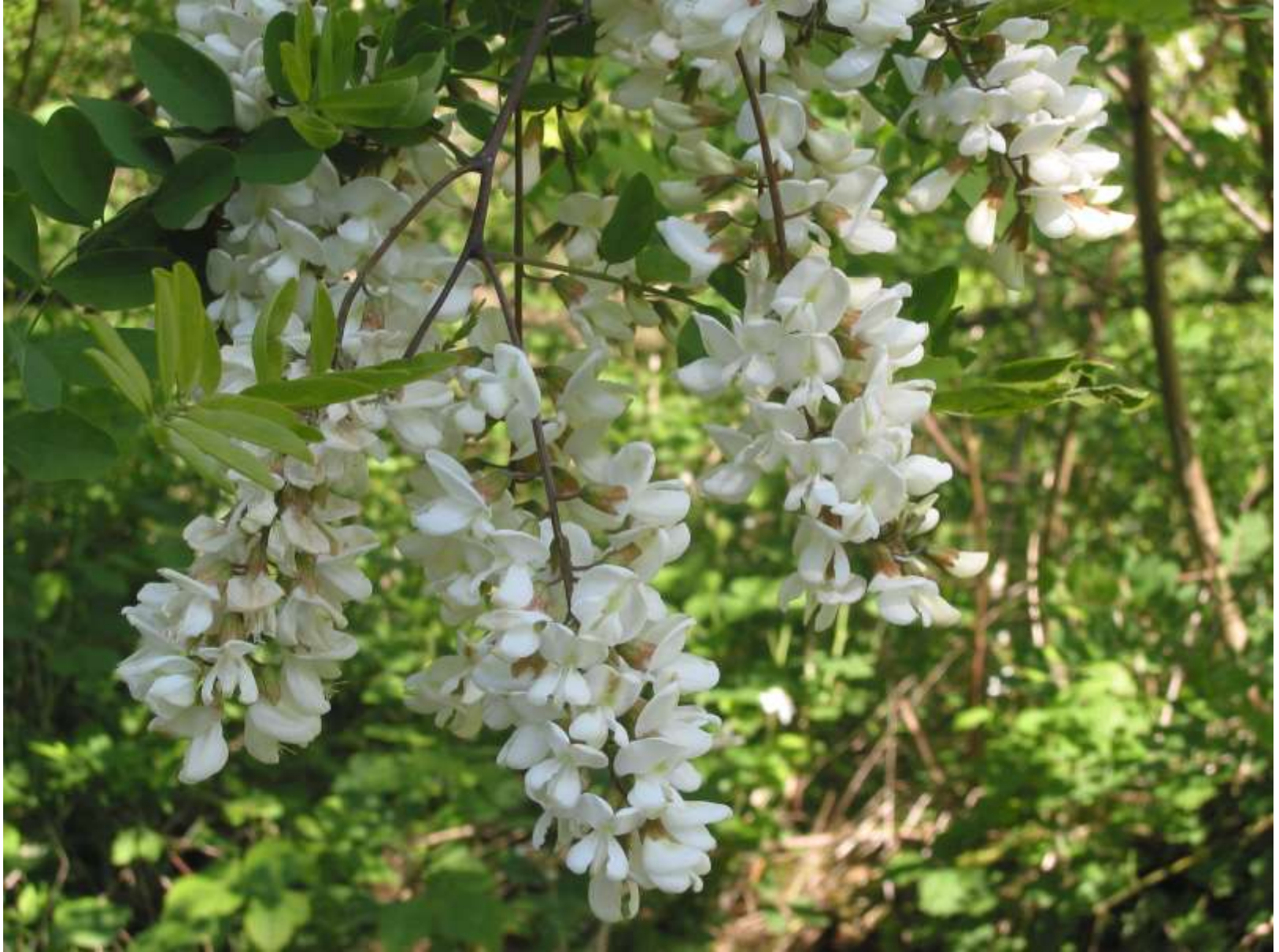
Robinia pseudoacacia - dall'America all'Europa