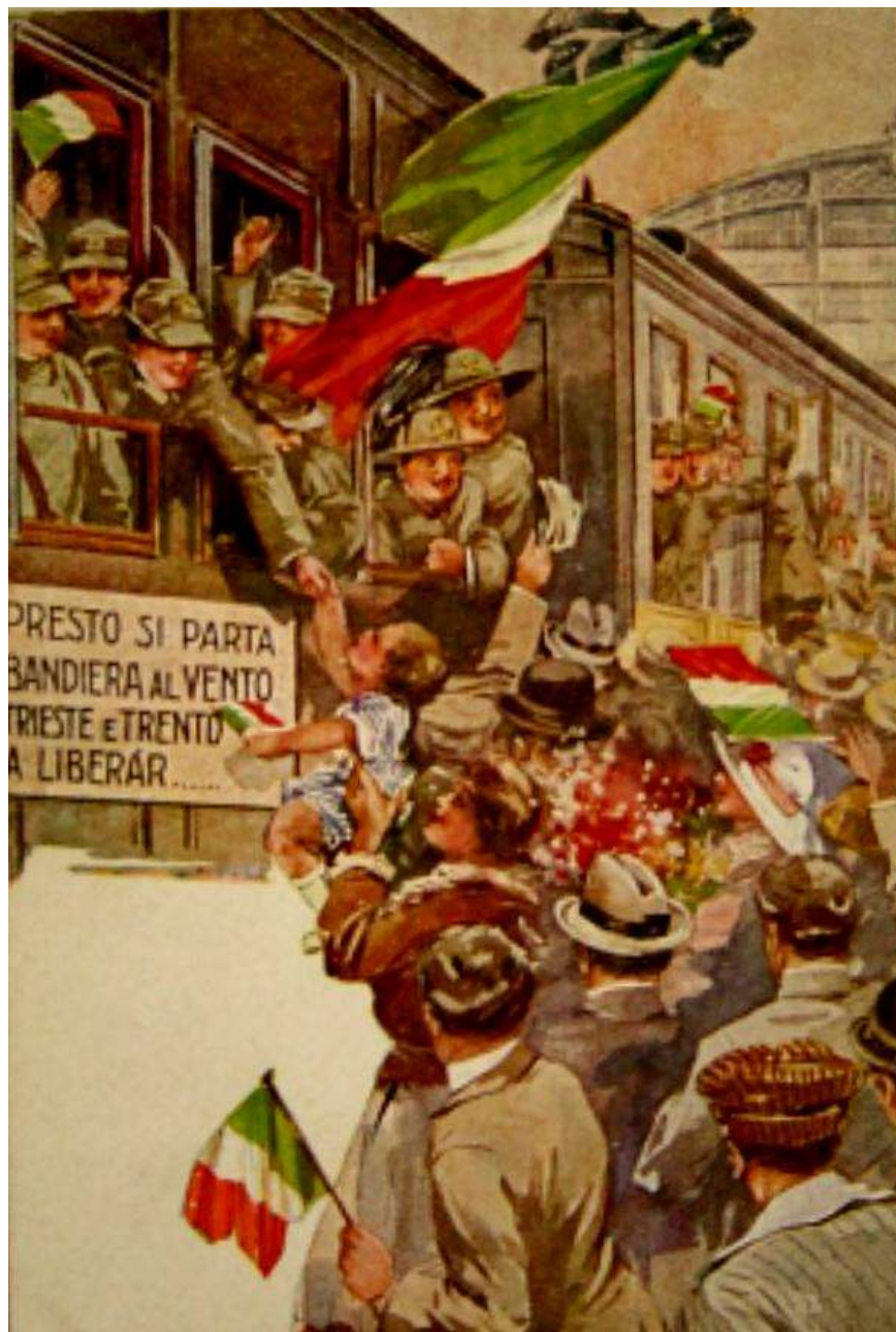
Stampa 1° Guerra Mondiale