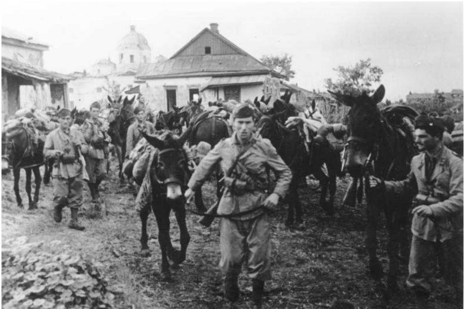
Bundesarchiv, Bild 183-B27180 Foto: Lachmann | Juli 1942