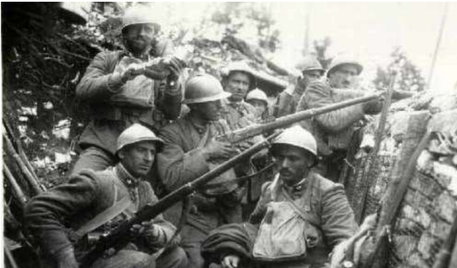
Trincea 1° Guerra Mondiale