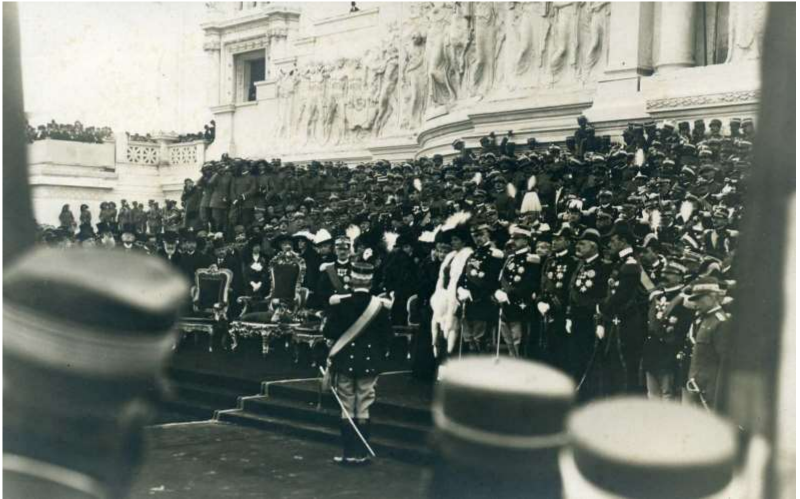
Inaugurazione del Vittoriano nel 1911 - 1° Guerra Mondiale