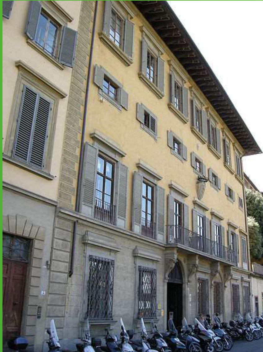
PALAZZO BARDI di Firenze