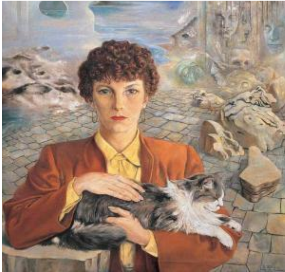
Rudolf Schlichter - Ritratto di Speedy