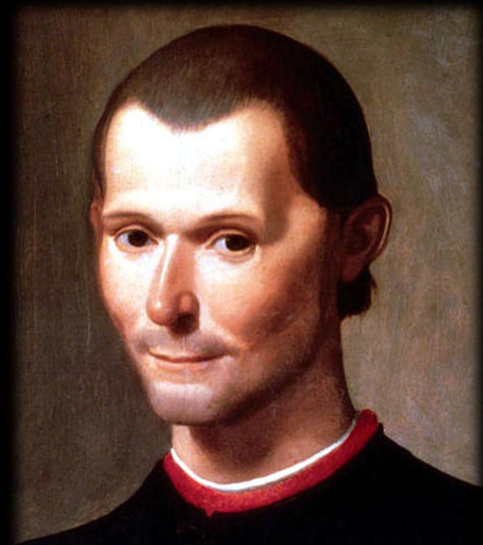
Niccolò Machiavelli (1469 - 1517)