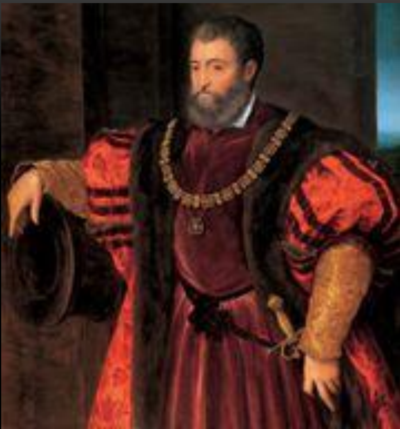
Alfonso D'Este Titiano