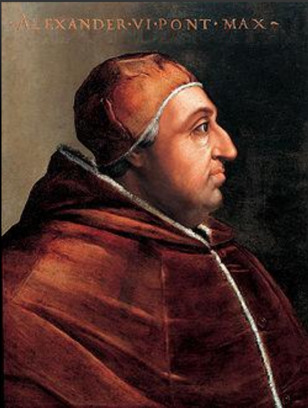
Alessandro VI papa