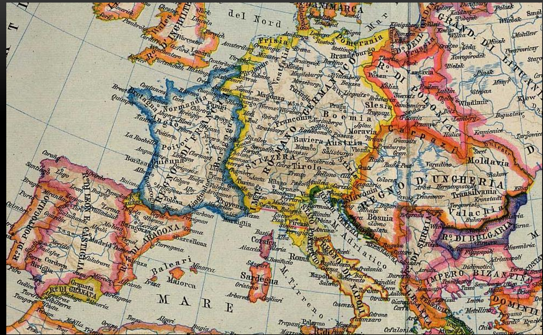
L'Europa nel XV secolo