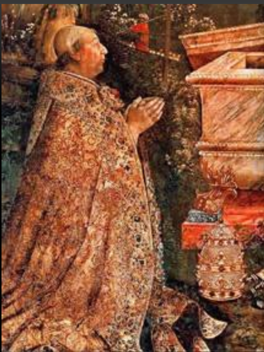
Papa Alessandro VI ritratto dal Pinturicchio, dettaglio della Resurrezione, Sala dei Misteri dell'Appartamento Borgia, in Vaticano