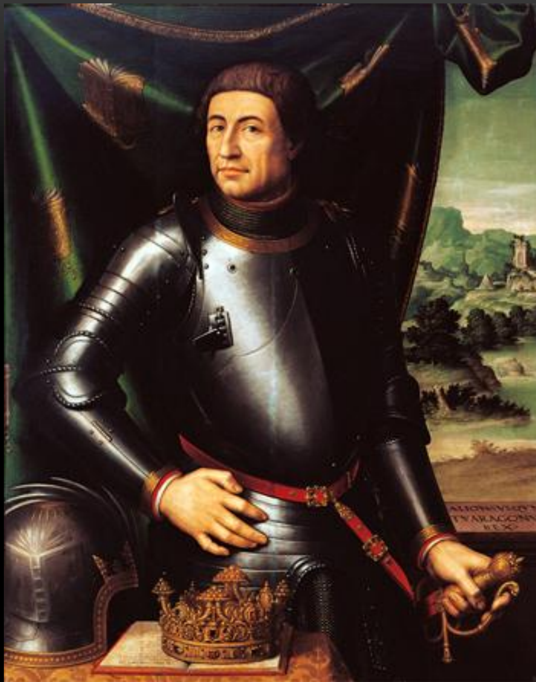
Alfonso D'Aragona, duca di Bisceglie