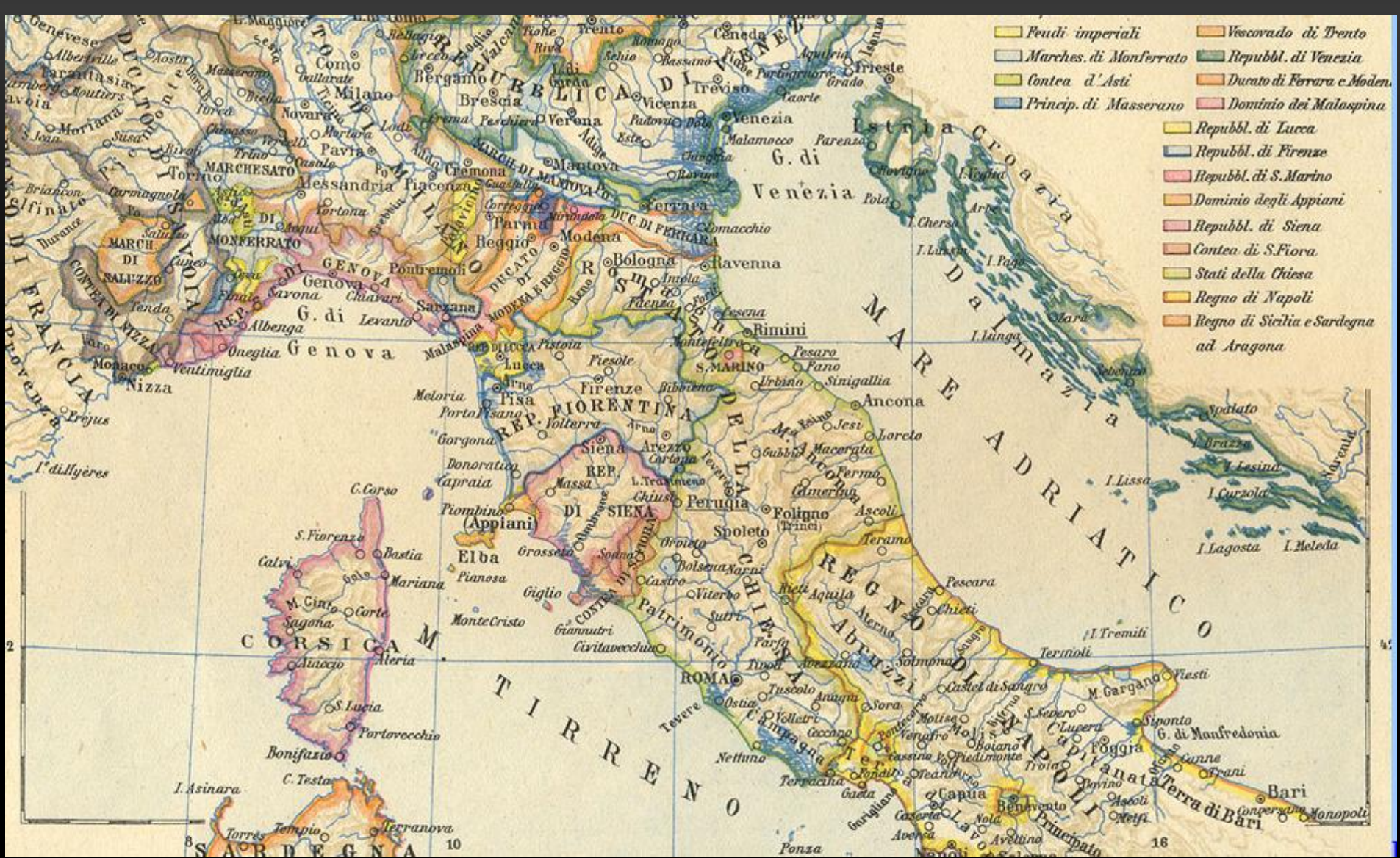
L'Italia nel XV secolo