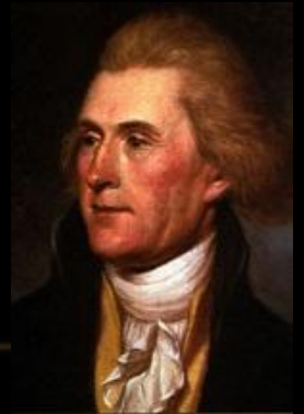
Thomas Jefferson, 1743-1826, III Presidente degli Stati Uniti d'America

«Io studio politica ed economia per permettere ai miei figli di studiare matematica e filosofia e, in questo modo, i miei figli permetteranno ai miei nipoti di studiare musica e pittura»