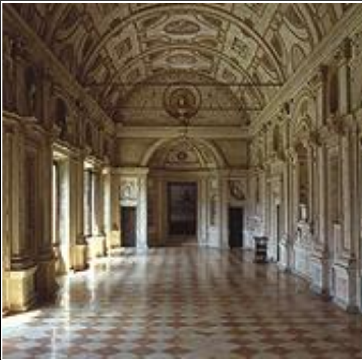
Galleria della Mostra – Palazzo Ducale