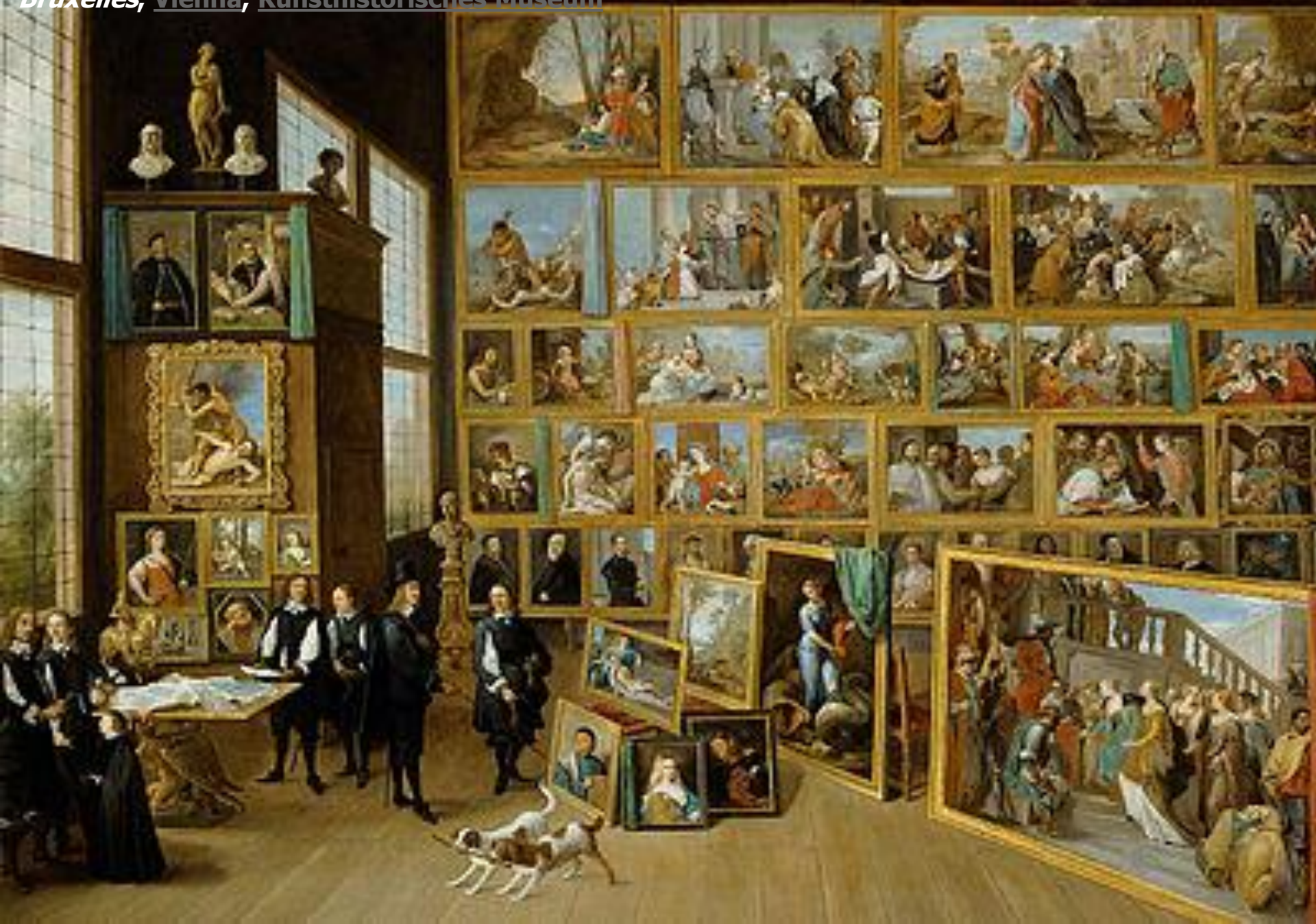
David Tenier il Giovane, La galleria dell'Arciduca Leopoldo Guglielmo a Bruxelles, Vienna, Kunsthistorisches Museum