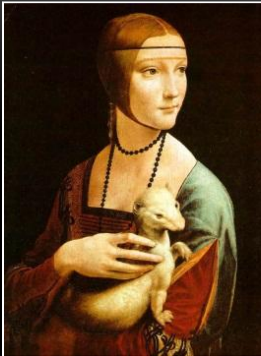
Dama con l'ermellino – Leonardo (Czartoryski Cracovia Museum)