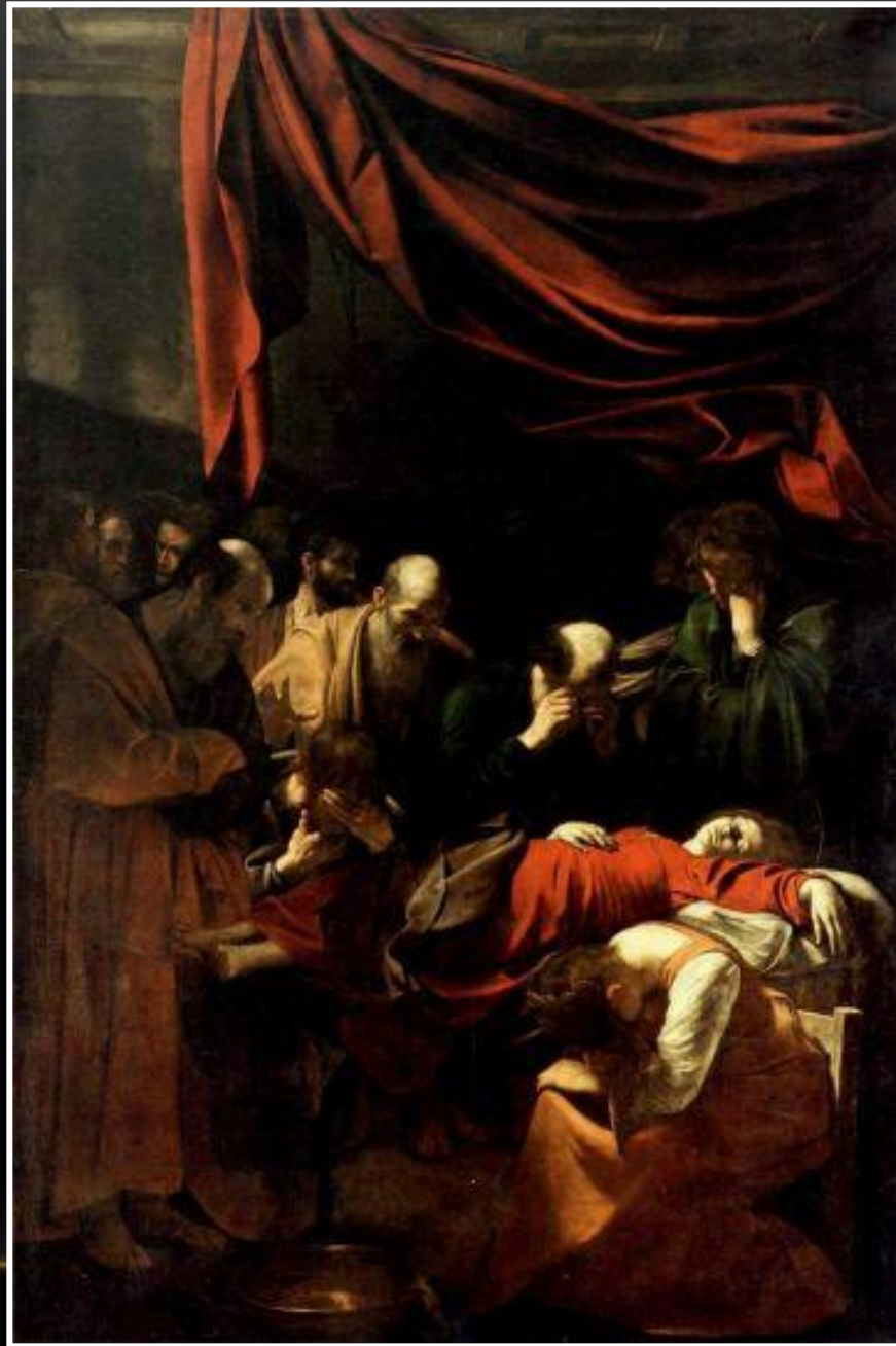
Morte della Vergine – Caravaggio (Louvre, Parigi)