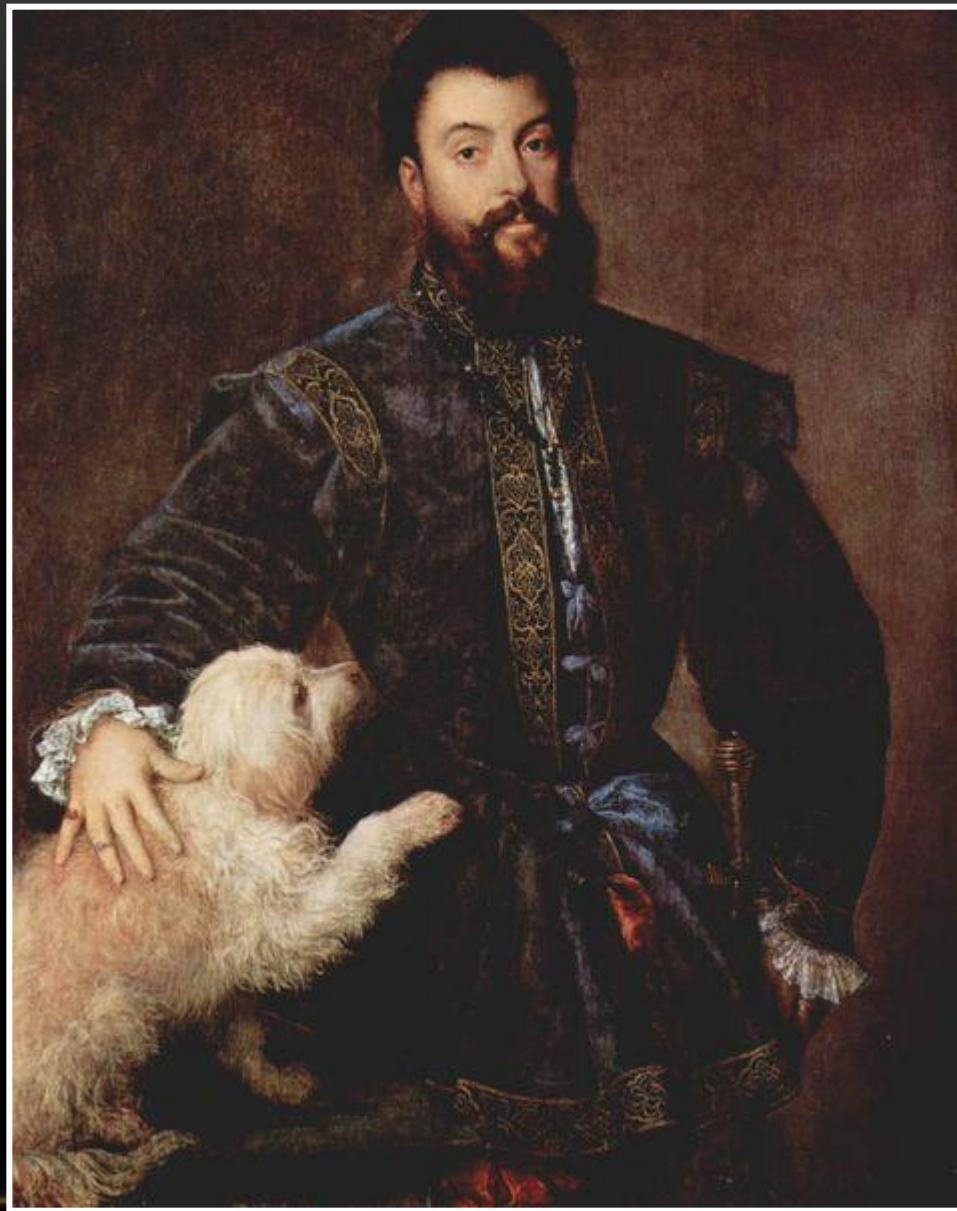
Federico Gonzaga - Tiziano Prado - Madrid