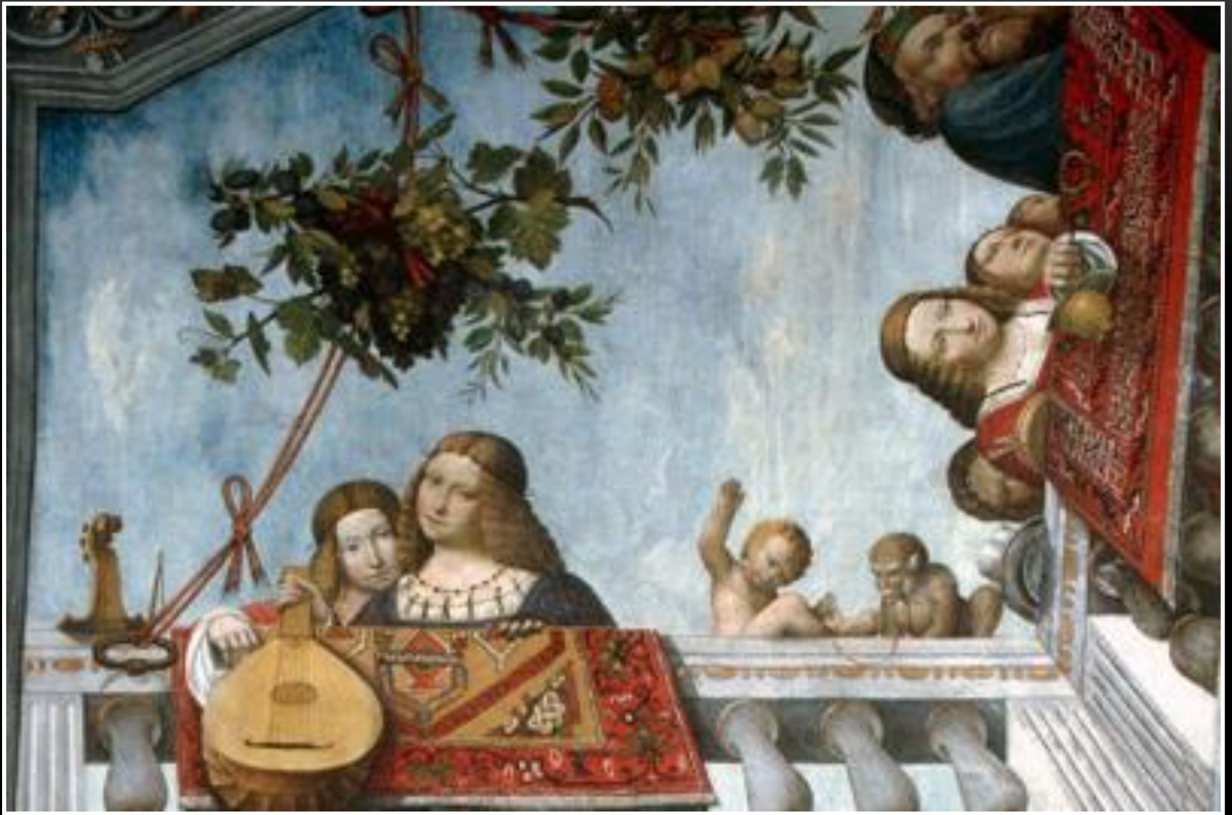
Isabella e Beatrice d'Este - Garofalo Palazzo di Ludovico il Moro - Ferrara