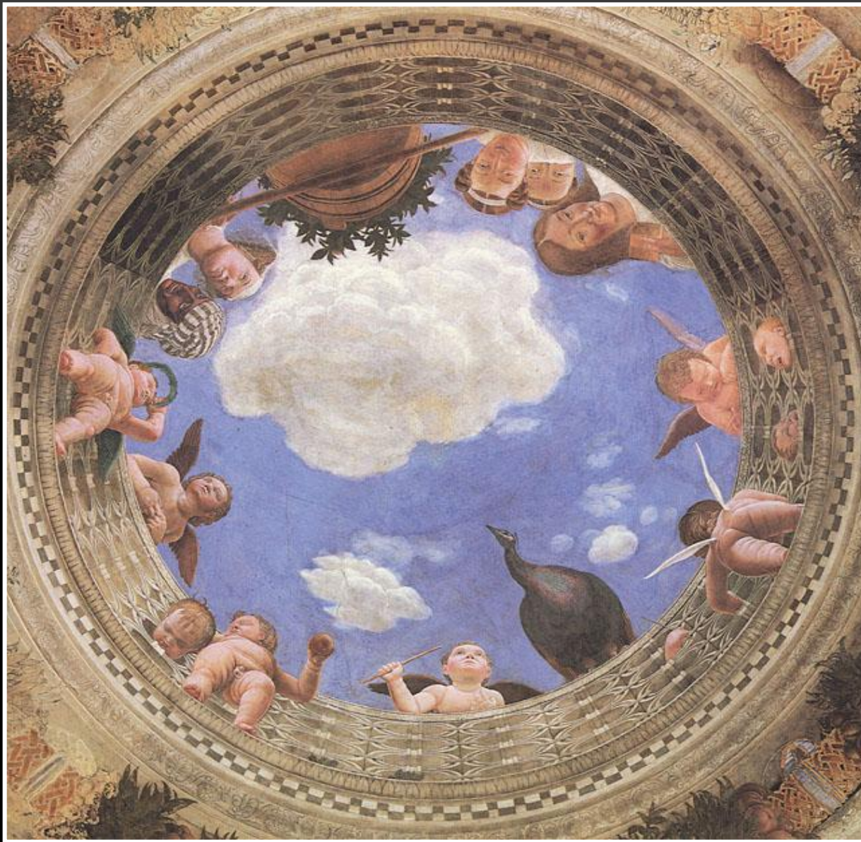
Camera degli Sposi - Andrea Mantegna Castello di S.Giorgio - Mantova