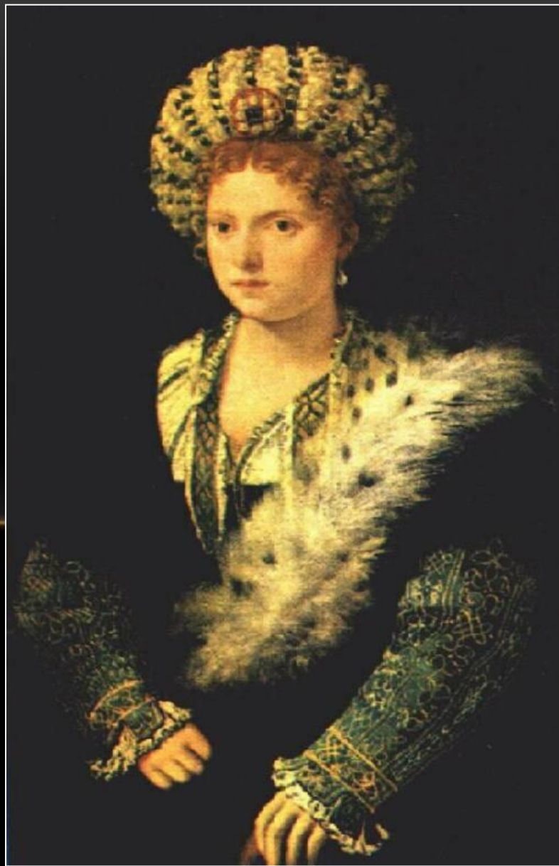
Ritratto di Isabella d'Este - Tiziano Kunsthistorisches Museum - Vienna