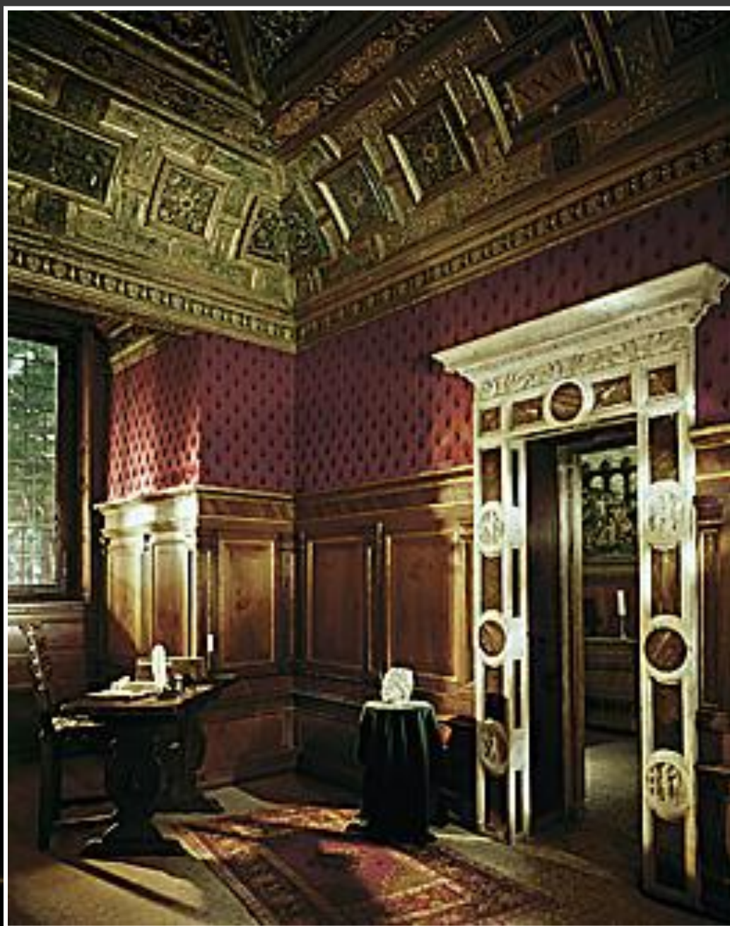
Lo studiolo e la Grotta