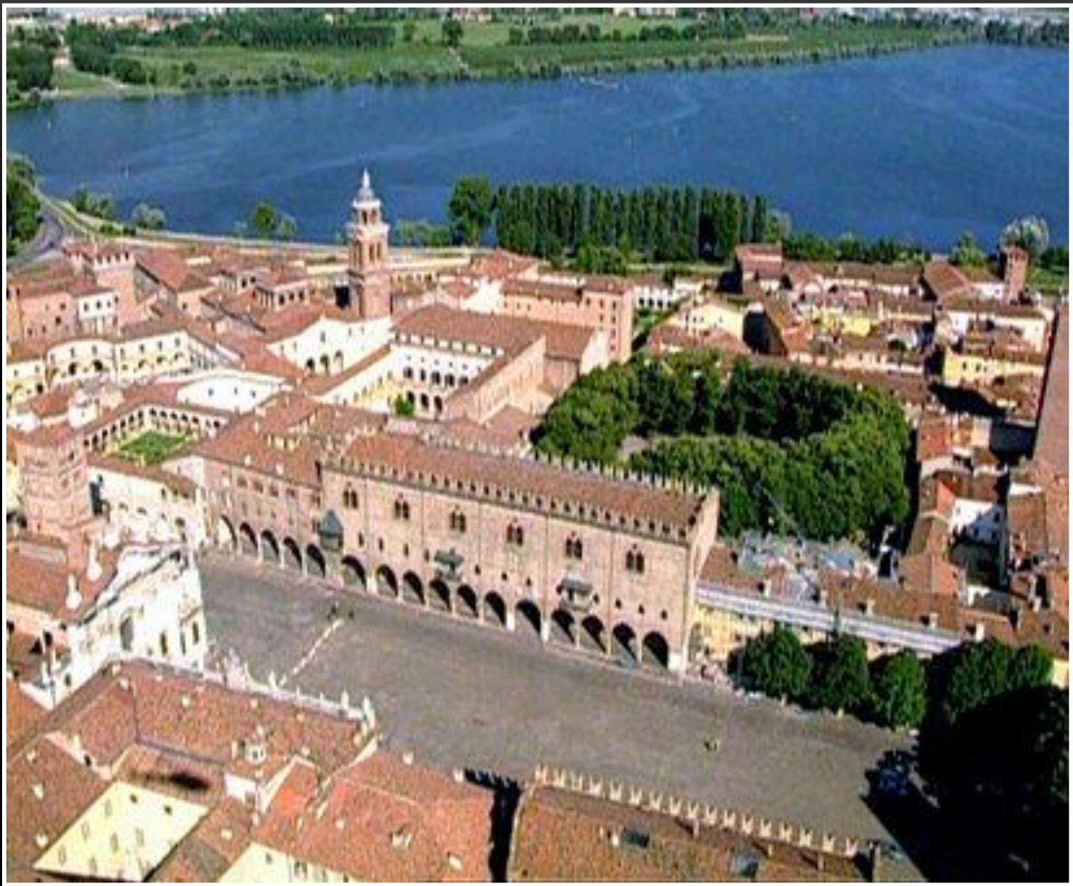
Palazzo Ducale e Castello di S. Giorgio - Mantova