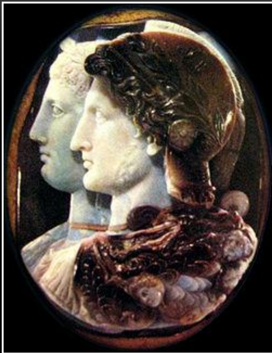
Cammeo dei Gonzaga (Hermitage, San Pietroburgo)