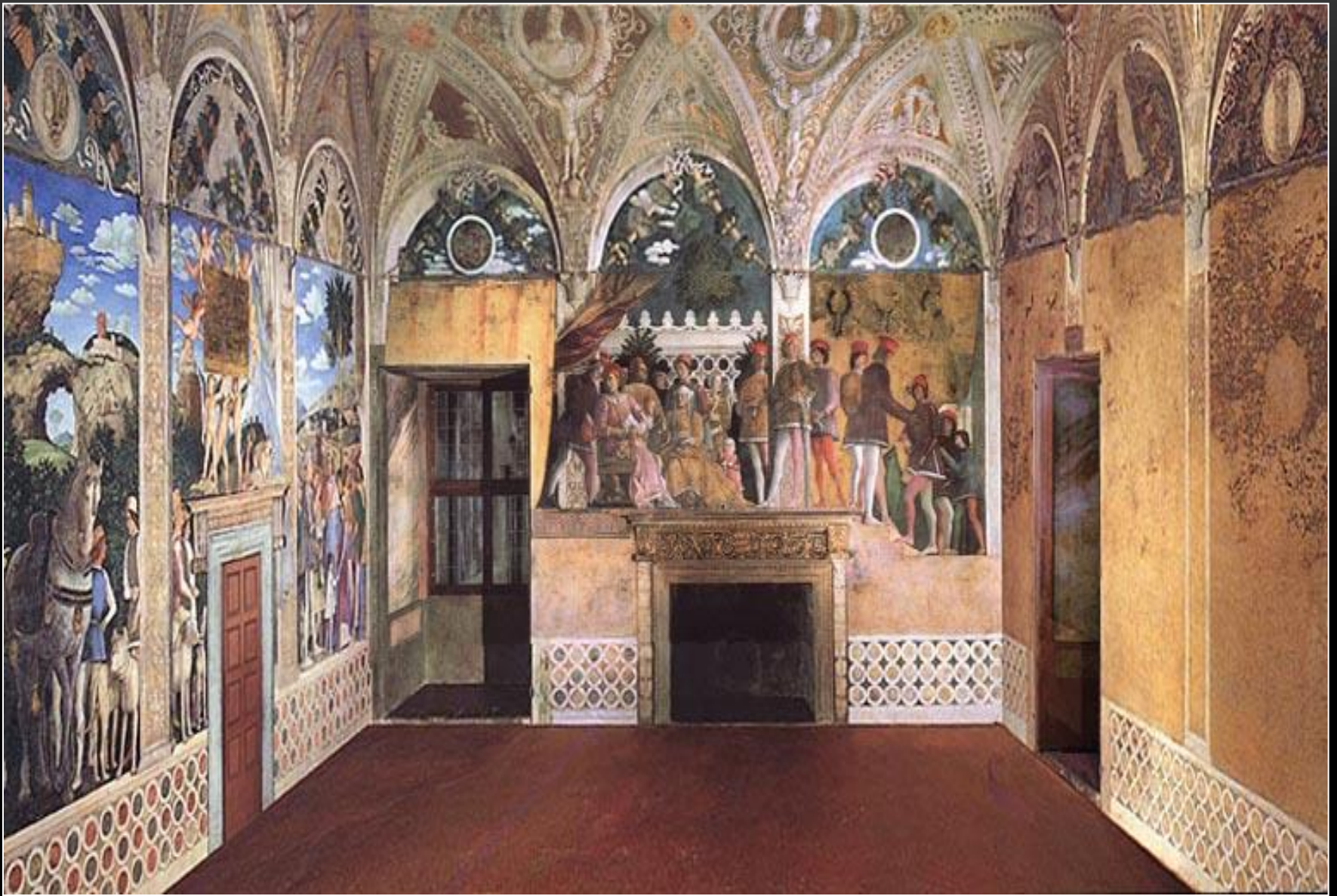
Camera Picta - Andrea Mantegna Castello di S.Giorgio - Mantova