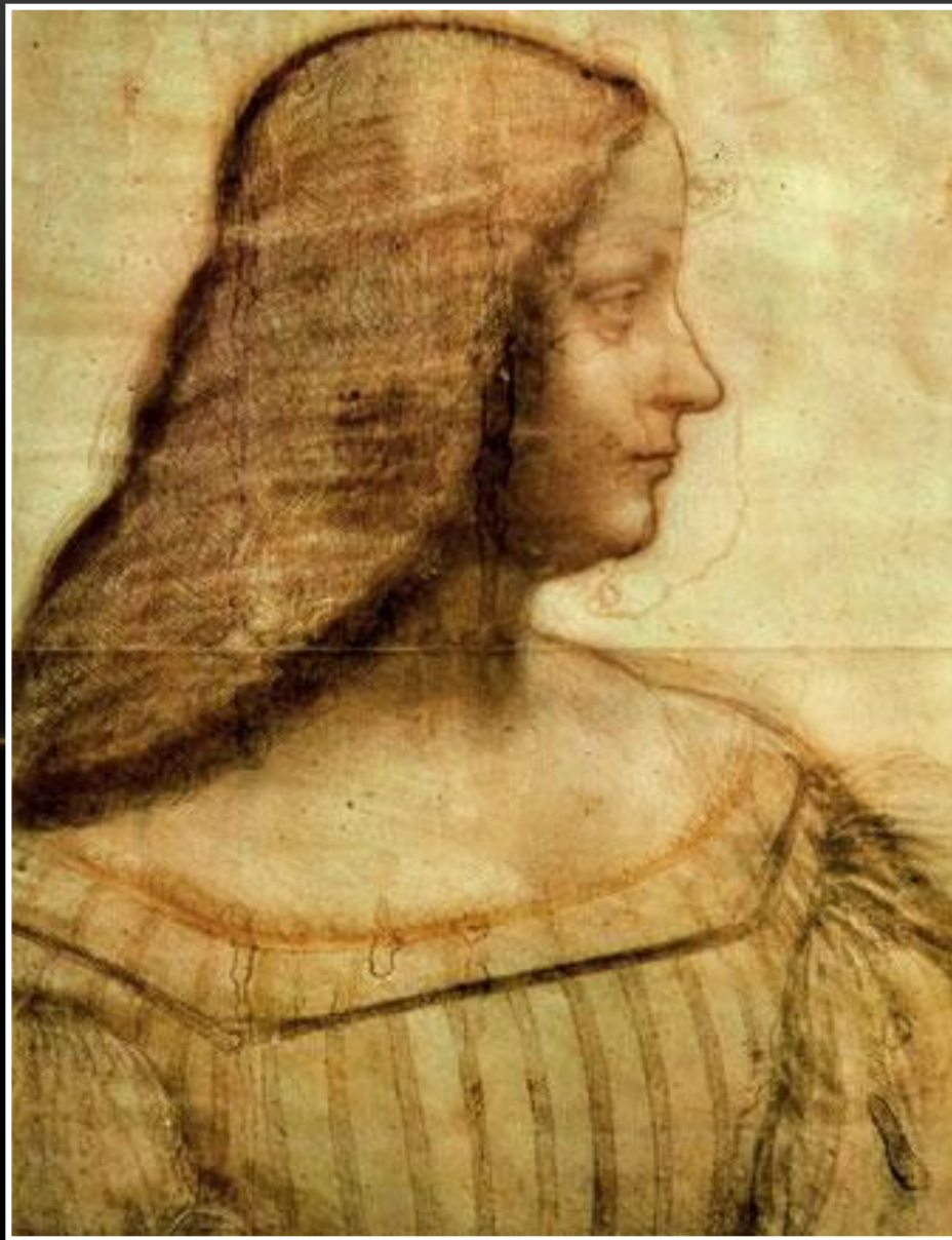
Isabella d'Este - Leonardo da Vinci Louvre - Parigi