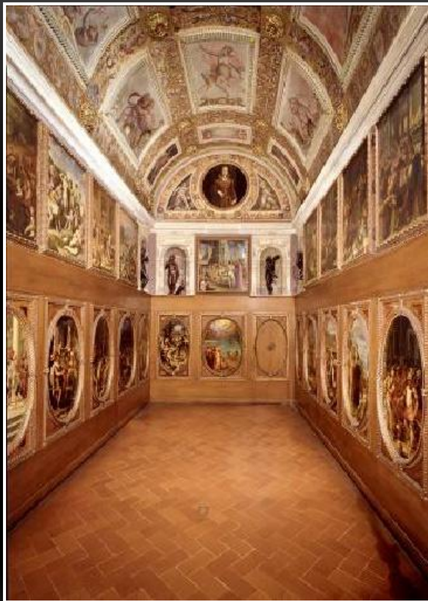
Lo Studiolo di Francesco de' Medici