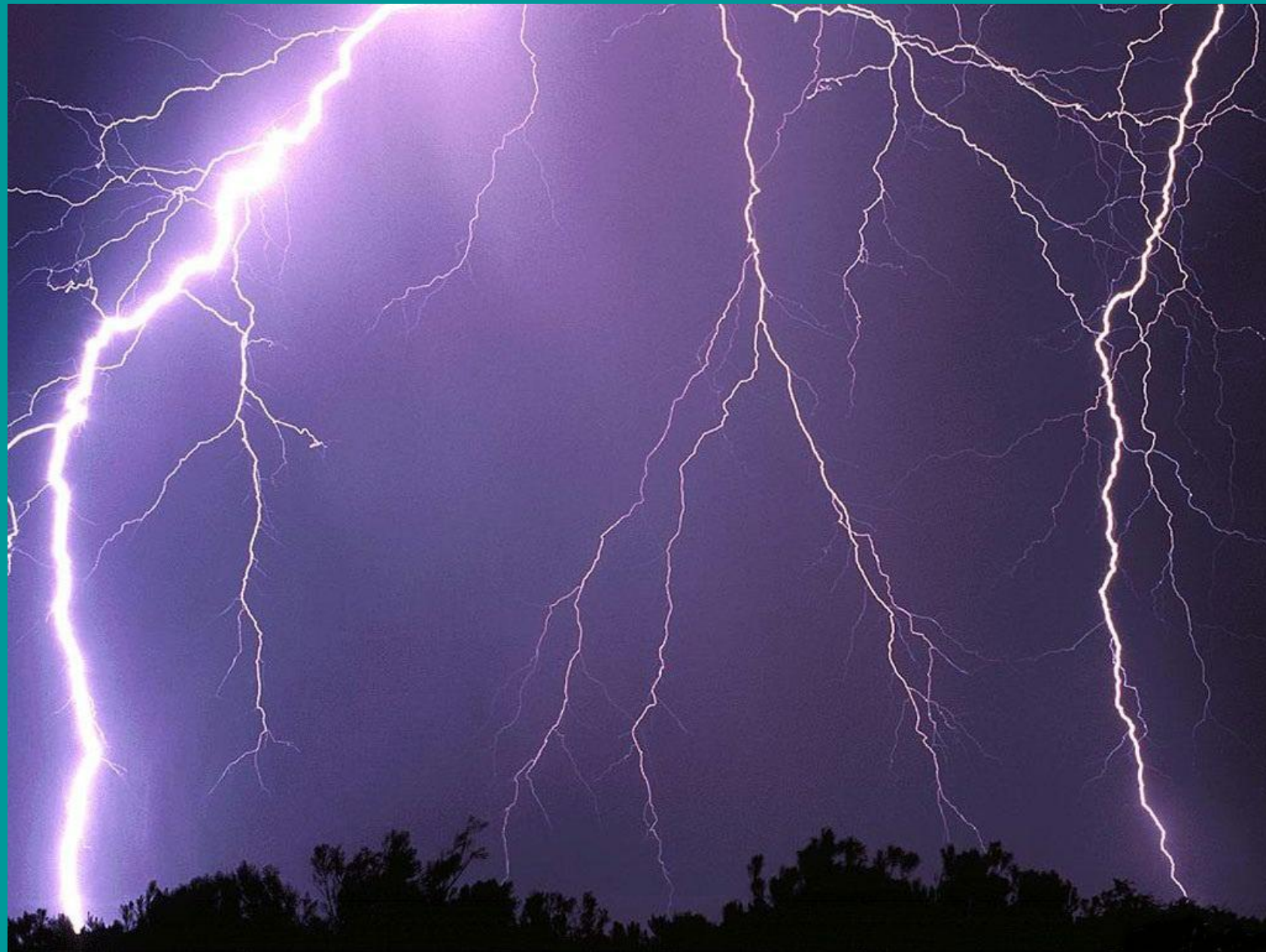
Lucia Todaro, psicopedagoga e consulente di formazione