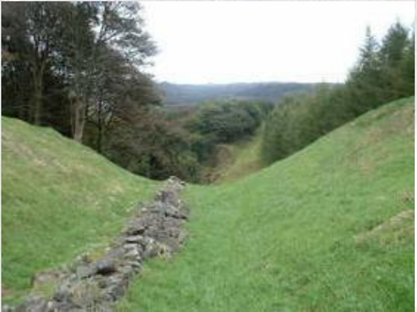
Vallo di Antonino