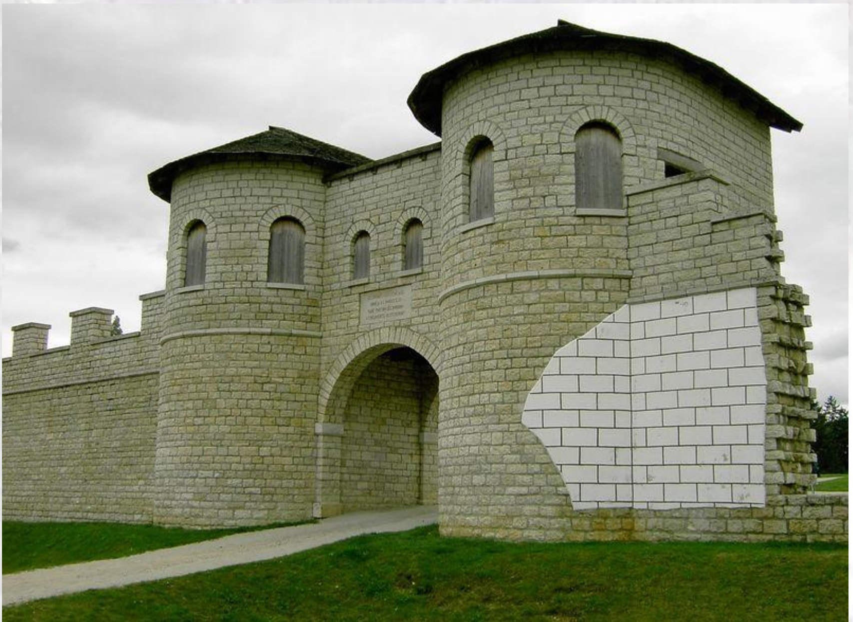
Ricostruzione Porta Pretoria in Weisenburg