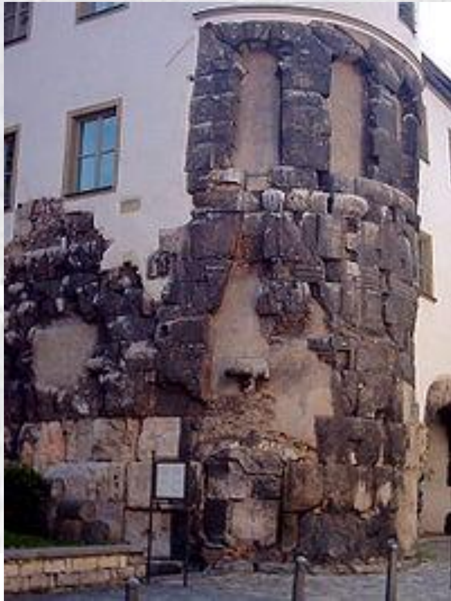
Porta Pretoria in Rezia Regensburg