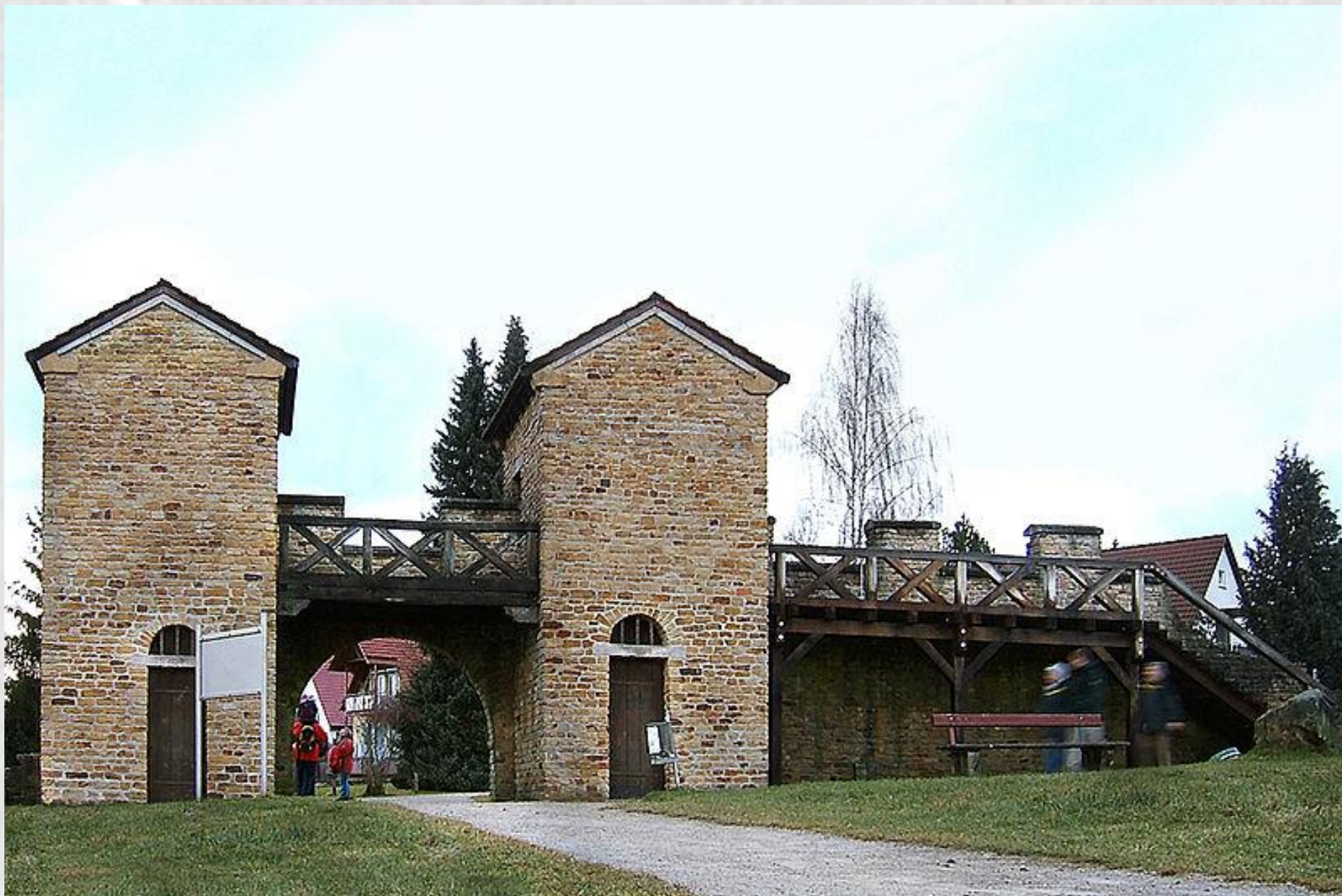
Ricostruzione Porta Pretoria in Welheim