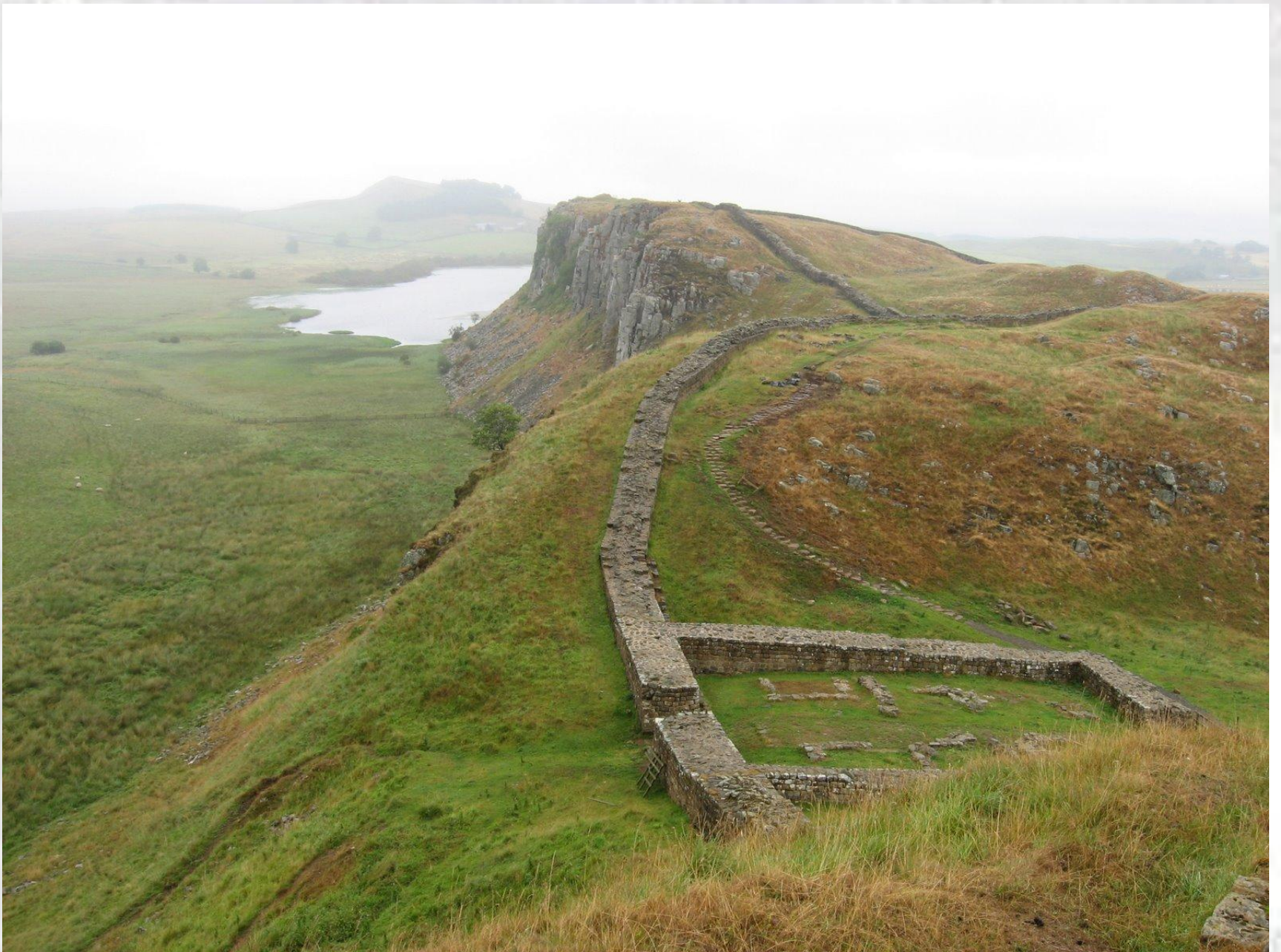
Vallo di Antonino