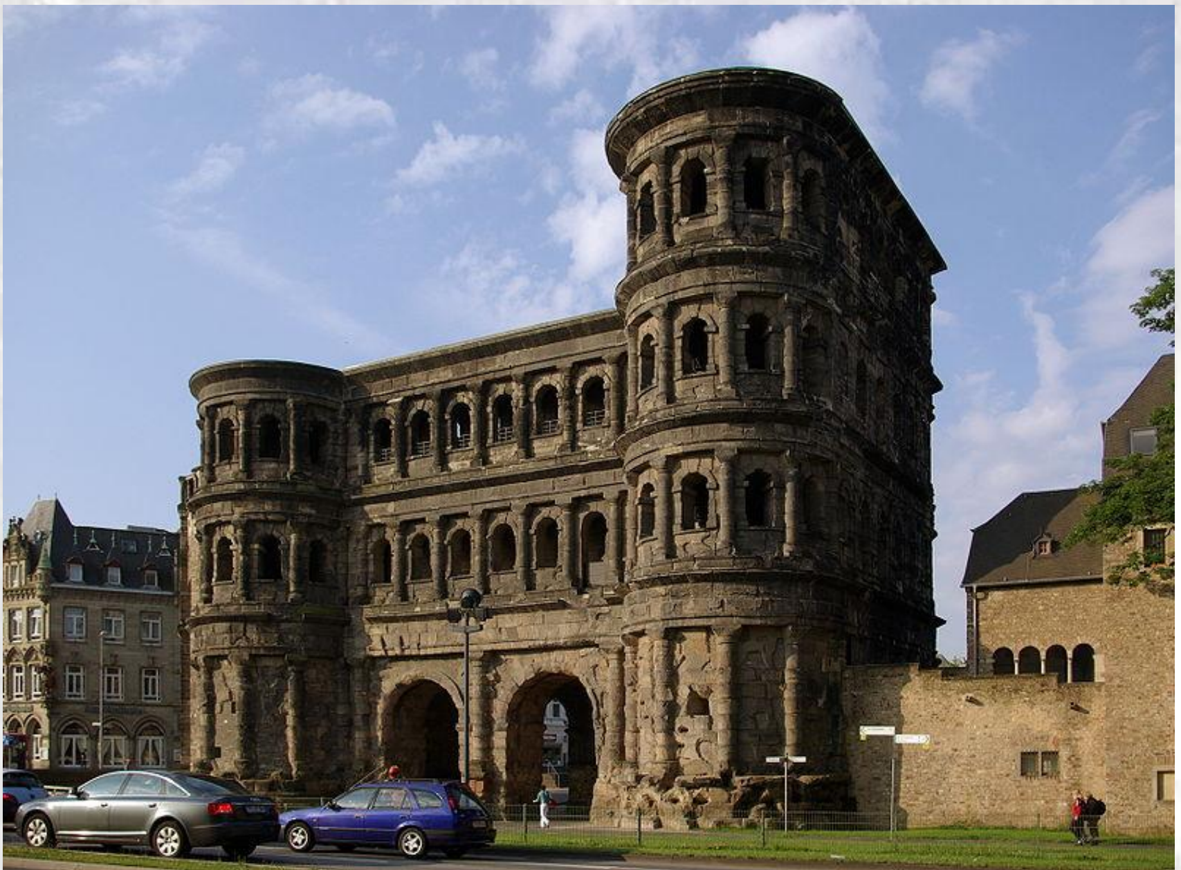
Porta Nigra oggi