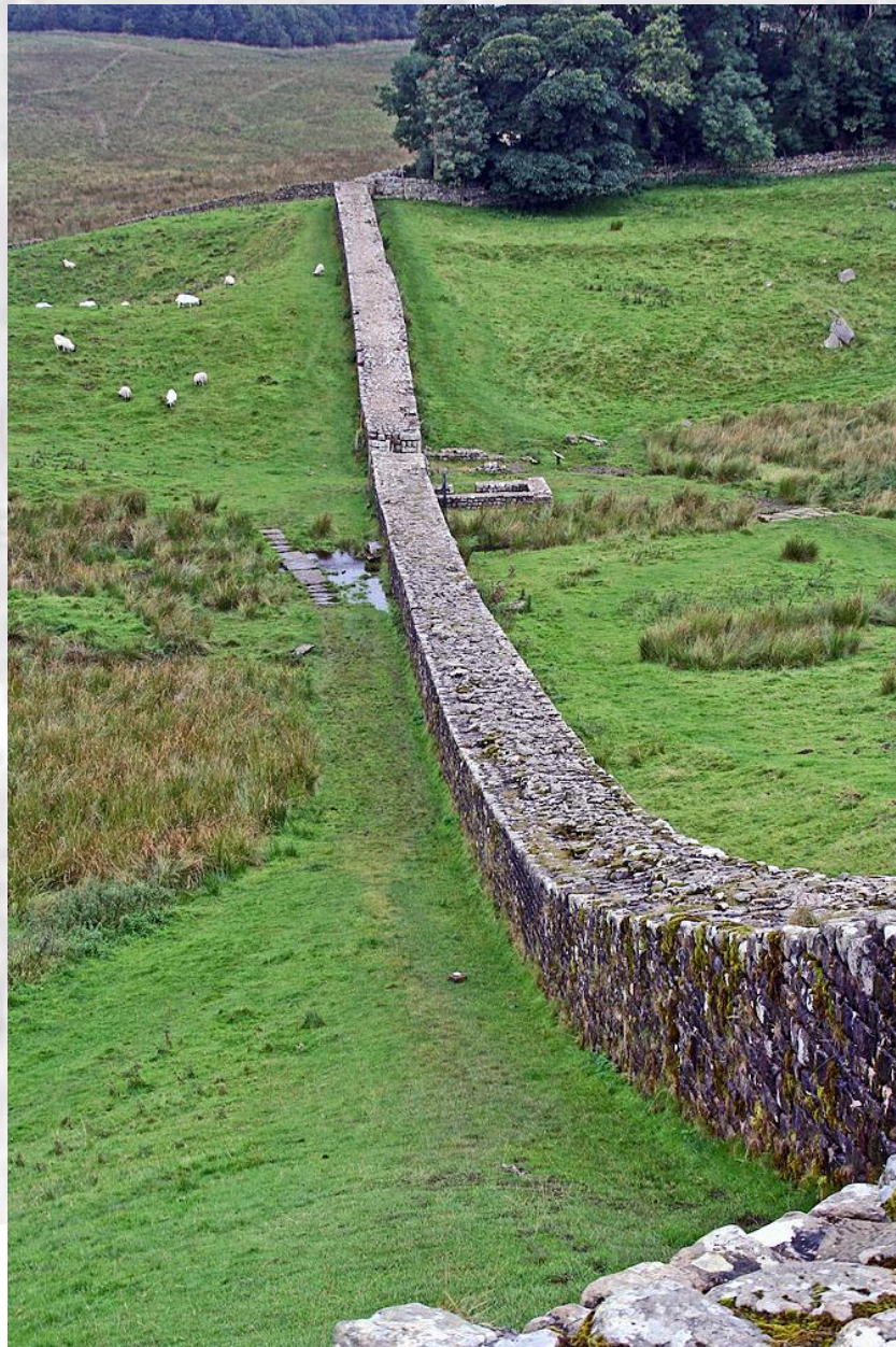
Vallo di Adriano