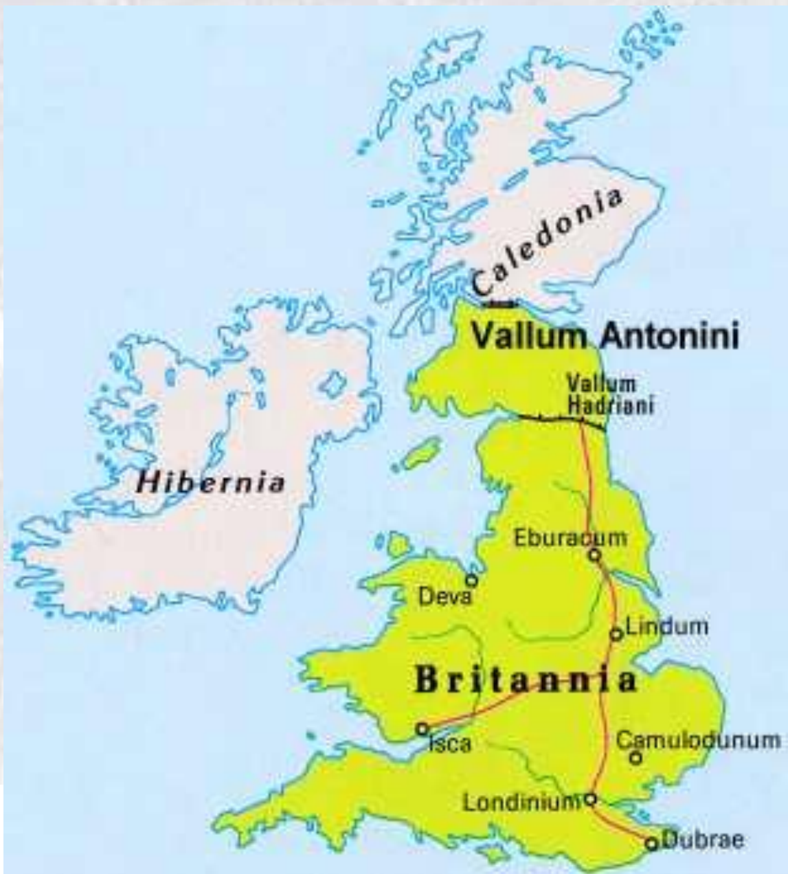
Vallo di Antonino, cartina